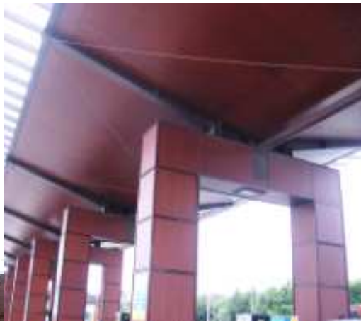
Yvetot – Centre Leclerc