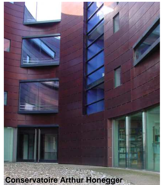
Conservatoire Arthur Honegger