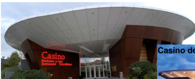
Casino de Hauteville