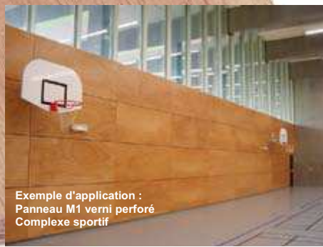
Exemple d'application : Panneau M1 verni perforé Complexe sportif