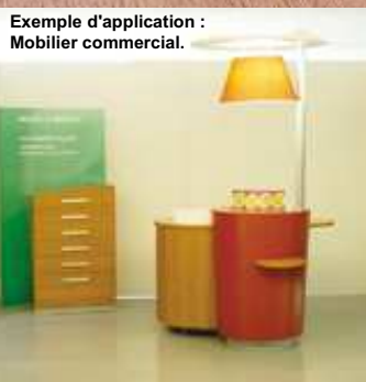
Exemple d'application : Mobilier commercial.