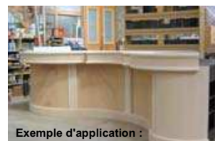
Exemple d'application : Comptoir de bar